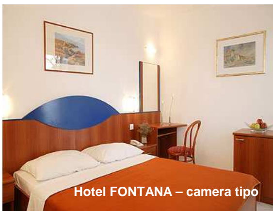
Hotel FONTANA – camera tipo

QUOTA ISCRIZIONE/ ASSICURAZIONE MEDICO BAGAGLIO/ GARANZIA ANNULLAMENTO: € 40,00 per persona adulta - € 35,00 per bambini 6/12 anni - € 25,00 per bambini 0/6 anni.